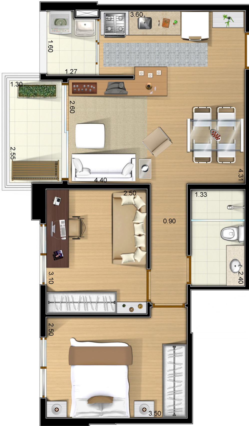
52,5m 2 apto tipo